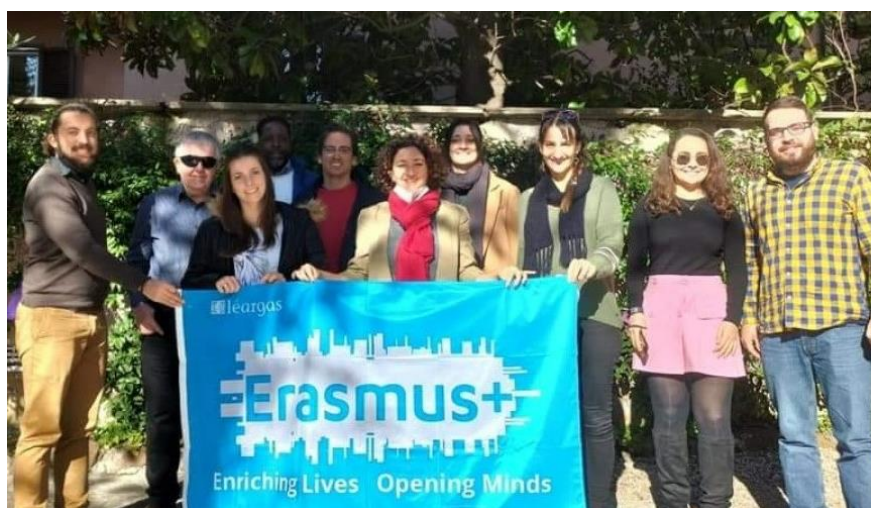
Transnational Kick-off partnership meeting in Rome, November 2021

DigiGuide combina il convalidato metodo dei Casi di Studio con una nuova dimensione digitale e mira a massimizzare il potenziale dell'apprendimento interattivo, mantenendo l'alto valore di scambio, interazione e identificazione che è stato il punto di forza dei precedenti progetti Guide. Scopri di più nel nostro sito web del progetto